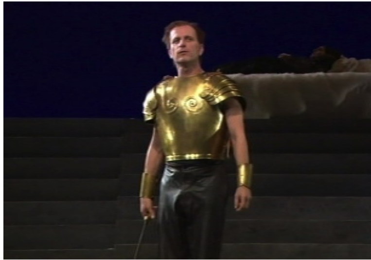
Ithaque : Ulysse

Le 7 janvier 2011 a été créée au Théâtre de Nanterre-Amandiers pour la première fois en français la pièce de théâtre Ithaque de Botho Strauss, l'un des deux auteurs dramatiques allemands contemporains le plus joués en Europe. Il s'agit d'une transposition scénique du récit homérique du retour d'Ulysse, depuis le moment où il pose le pied sur la plage de son île jusqu'à ce que les proches des prétendants assassinés renoncent à leur vengeance.