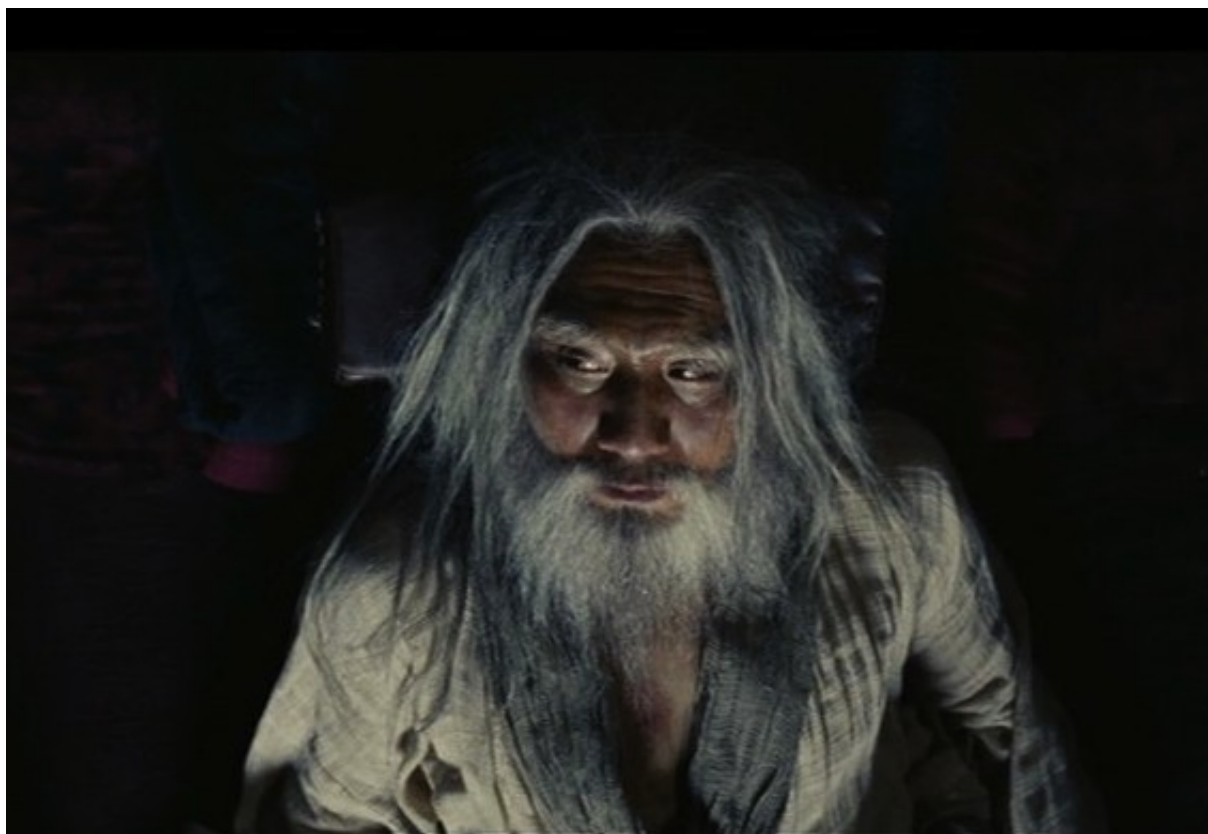
The Last Supper : Liu Bang à la veille de sa mort

Au contraire, The Last Supper est un film brillant et cherchant à montrer habilement comment deux opposants farouches à la domination des Qin, d'abord amis et alliés, vont progressivement glisser dans l'inimitié, puis la haine la plus profonde. On voit des portraits psychologiques nuancés et on ne tombe pas dans le manichéisme du bon et du méchant.