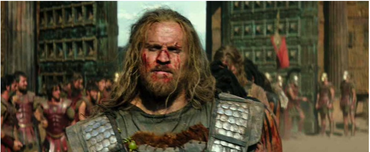
Hercule (Brett Ratner) : le "méchant" roi Rhésos vaincu et prisonnier