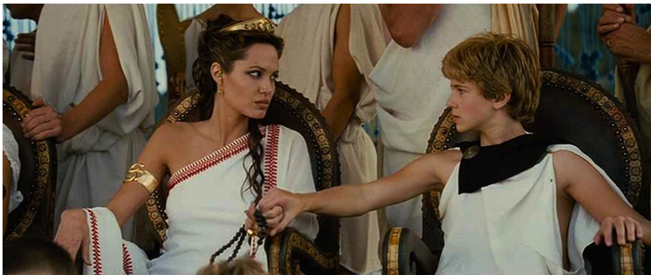
Angelina Jolie incarne Olympias, mère d'Alexandre

simple sex-symbol, ce qu'elle n'était vraiment pas. C'était une mère, un commandant et une intellectuelle qui parlait cinq langues !"