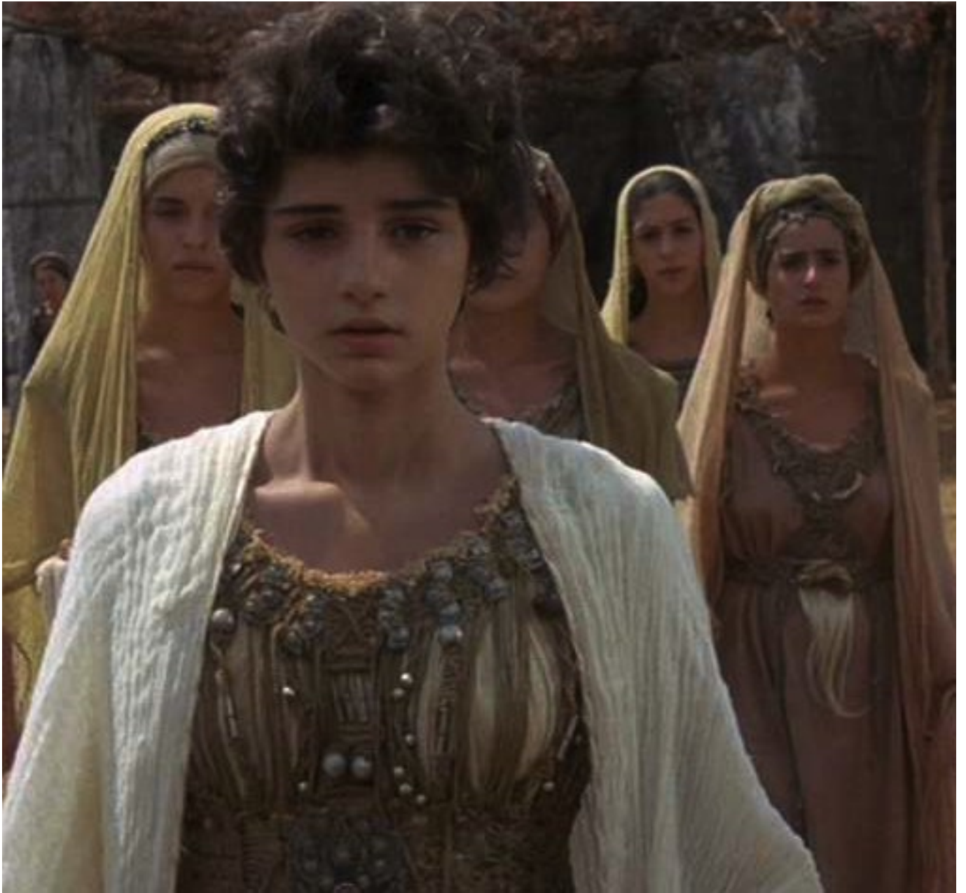
Iphigénie de Cacoyannis : Iphigénie

Cette adaptation libre de la tragédie grecque d'Euripide est vraiment bouleversante, et le spectateur se trouve confronté à des drames qui dépassent amplement le dilemme humain : Agamemnon, Ménélas, Clytemnestre, Achille, impuissants, sont emportés dans une fatalité qui ne laisse plus aucune place au libre-arbitre humain. Et Iphigénie, innocente victime d'une machination qui la dépasse, après avoir été prise par une peur panique, saura se montrer d'une dignité remarquable, qui peut être un modèle pour ses parents et pour les autres adultes.