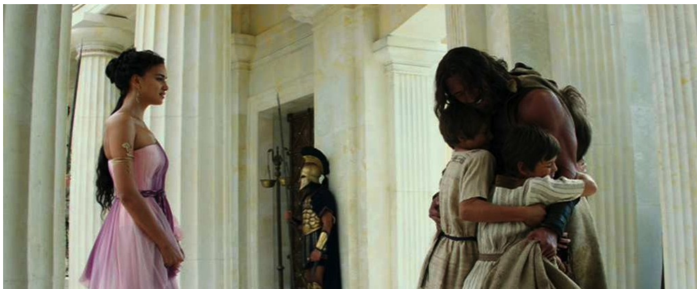
Hercule (Brett Ratner) : le héros avec sa femme Mégara et ses enfants

C'est pourquoi le film Hercule de Brett Ratner a été une heureuse surprise pour nous. Non pas que ce soit un chef-d'œuvre, mais parce que cela nous a fait plaisir de trouver un long-métrage antique moins médiocre que les autres.