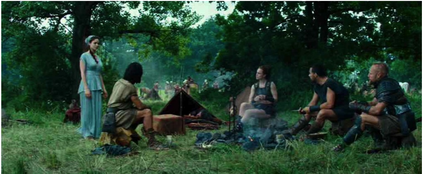
Hercule (Brett Ratner) : la princesse Ergénia avec les mercenaires, camarades d'Hercule

Lors de l'adaptation de ce roman graphique pour le grand écran, Steve Moore n'a pas pu faire valoir ses droits et a été écarté, en sorte qu'il a estimé que son œuvre avait été profondément altérée. Mais le spectateur qui voit le film en 3D en salle obscure n'a cure de ces dissensions et se contente d'apprécier ou pas l'histoire qu'on lui présente, soutenue par de nombreux effets spéciaux.