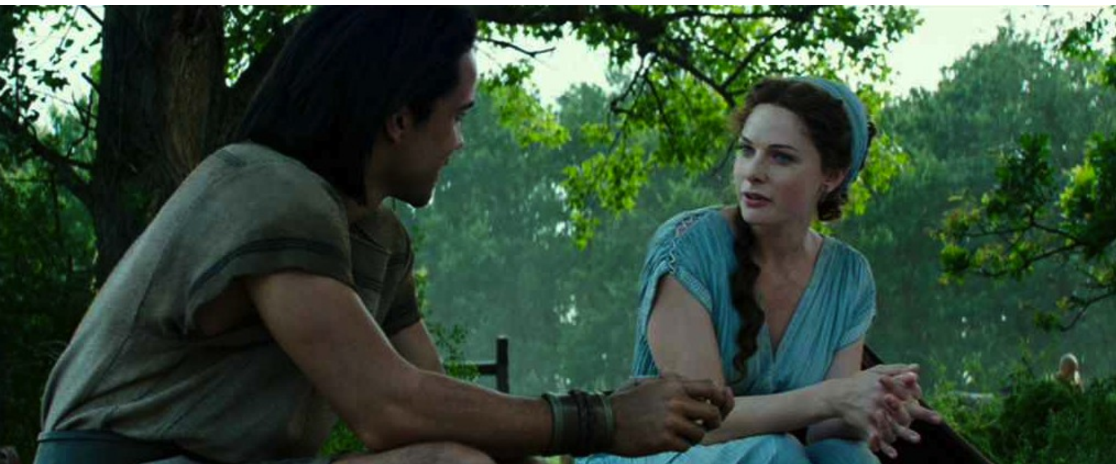
Hercule (Brett Ratner) : l'aède Iolaos, neveu d'Hercule, avec la princesse Ergénia

Le héros et sa troupe se mettent donc au service de Cotys, un des rois de Thrace. Mais Hercule est aussi naïf et bien intentionné que robuste. Il croit travailler pour un bon souverain contre le méchant monarque d'un pays voisin. Pourtant la noble mission tourne au cauchemar : le "bon" Cotys est un atroce usurpateur, et nos mercenaires ont formé à son attention des troupes qui pourraient lui permettre d'imposer son hégémonie sur tout le monde connu. Le musculeux héros et ses amis auront besoin de toutes leurs capacités pour sauver la situation.