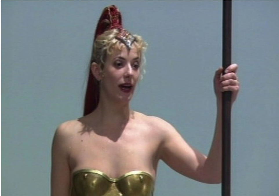
Ithaque : la déesse Athéna

Nous avons pu nous procurer la captation de ce spectacle. Notre impression personnelle est tout aussi contrastée : un texte habile et profond et respectueux des textes et traditions antiques (usage d'un chœur...), une mise en scène convaincante (à quelques exceptions près : Pénélope qui s'allume une cigarette...), une musique originale somptueuse ; mais le jeu de certains acteurs nous a déçu (notamment celui de Charles Berling/Ulysse à la voix fade et stéréotypée) et la prise de son est relativement médiocre et peu audible (ou bien est-ce la façon de parler des acteurs qui était peu compréhensible : une