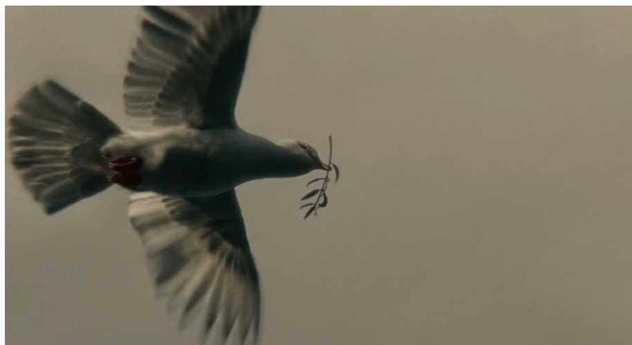
Noé de Darren Aronofski : la colombe

Le studio Paramount et Russell Crowe, qui incarnait le patriarche, étaient, paraît-il, tellement fiers de leur film qu'ils espéraient que le pape lui-même visionnât cette réalisation (l'acteur lui a même tweeté : "Seriously though, Noah the movie will fascinate you"! ). Nous ignorons comment le Saint-Père aurait apprécié le spectacle, mais, en ce qui nous concerne, nous avons été effrayé : nous nous attendions à un péplum biblique, nous avons vu une heroic fantasy à gros effets spéciaux, avec des Néphilim, monstres de pierre dignes des Maciste de série B, des geysers destinés à couvrir rapidement d'eau la terre, et surtout un Noé guerrier, missionnaire écologiste et intégriste fanatique et égoïste, qui se croit investi de la mission d'éliminer une fois pour toutes l'humanité, dût-il aller jusqu'à assassiner de ses propres mains ses petits-enfants.