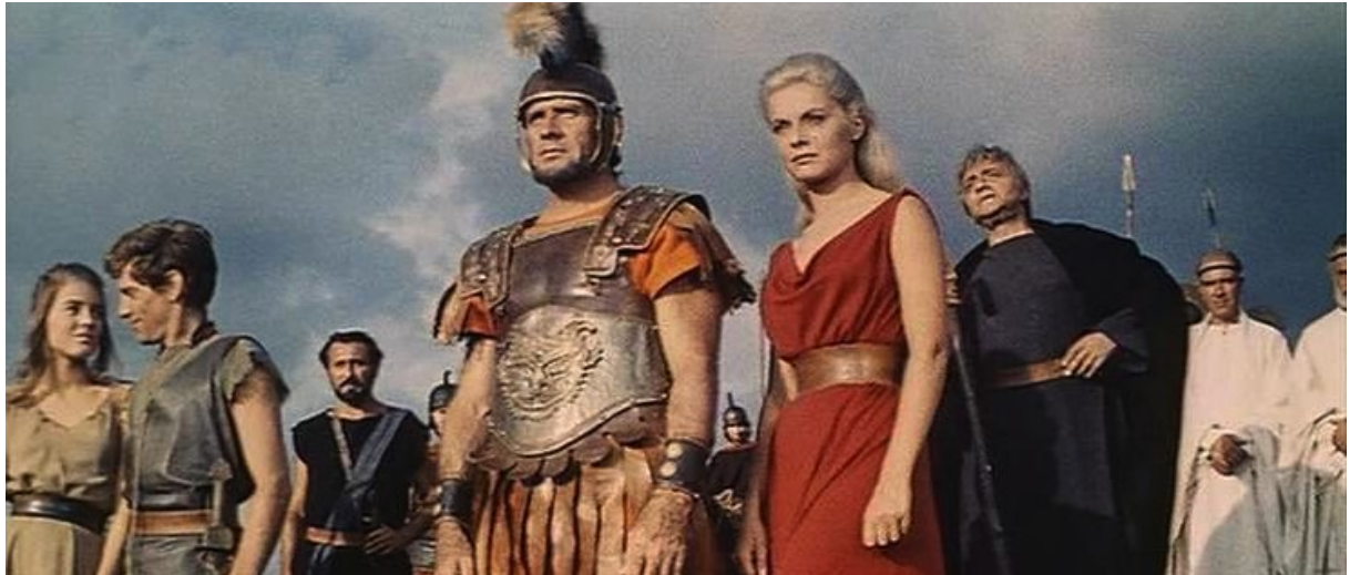
Le roi des Sabins Tatius et sa fille Julia (Virna Lisi) dans Romulus et Rémus de Sergio Corbucci

Le 18 décembre 2014 s'est éteinte à l'âge de 78 ans la grande actrice italienne Virna Lisi.