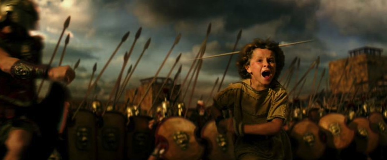
Hercule (Brett Ratner) : le jeune prince Arius échappe aux méchants au milieu des traits

Dans le film, elle a un fils, Arius, que le sinistre monarque menace de tuer si sa fille ne lui obéit pas au doigt et à l'œil. Tombée réellement amoureuse d'Hercule, elle est sur le point d'être décapitée sur l'ordre de son père quand le musculeux héros, dans un sursaut de rage, arrache ses chaînes et sauve la princesse. Restera à sauver le petit, utilisé comme otage par son abominable grand-père.