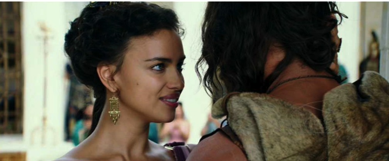
Hercule (Brett Ratner) : Mégara et Hercule