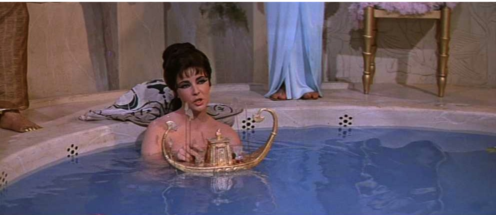
Cléopâtre (Liz Taylor) au bain

Cléopâtre porterait-elle la poisse ? Le film avec Liz Taylor, dont tout le monde conserve des images fortes, a laissé finalement un souvenir amer aux professionnels de l'industrie. Les problèmes pulmonaires de la star ainsi que son idylle enflammée avec Richard Burton, en 1962, ont failli couler la Century Fox en faisant grimper le budget de 2 à 44 millions de dollars ( Ben Hur a coûté trois fois moins) ! Au final: un monument de quatre heures, de mauvaises critiques, quelques oscars secondaires... Mais une place dans le panthéon des films mythiques de Hollywood.