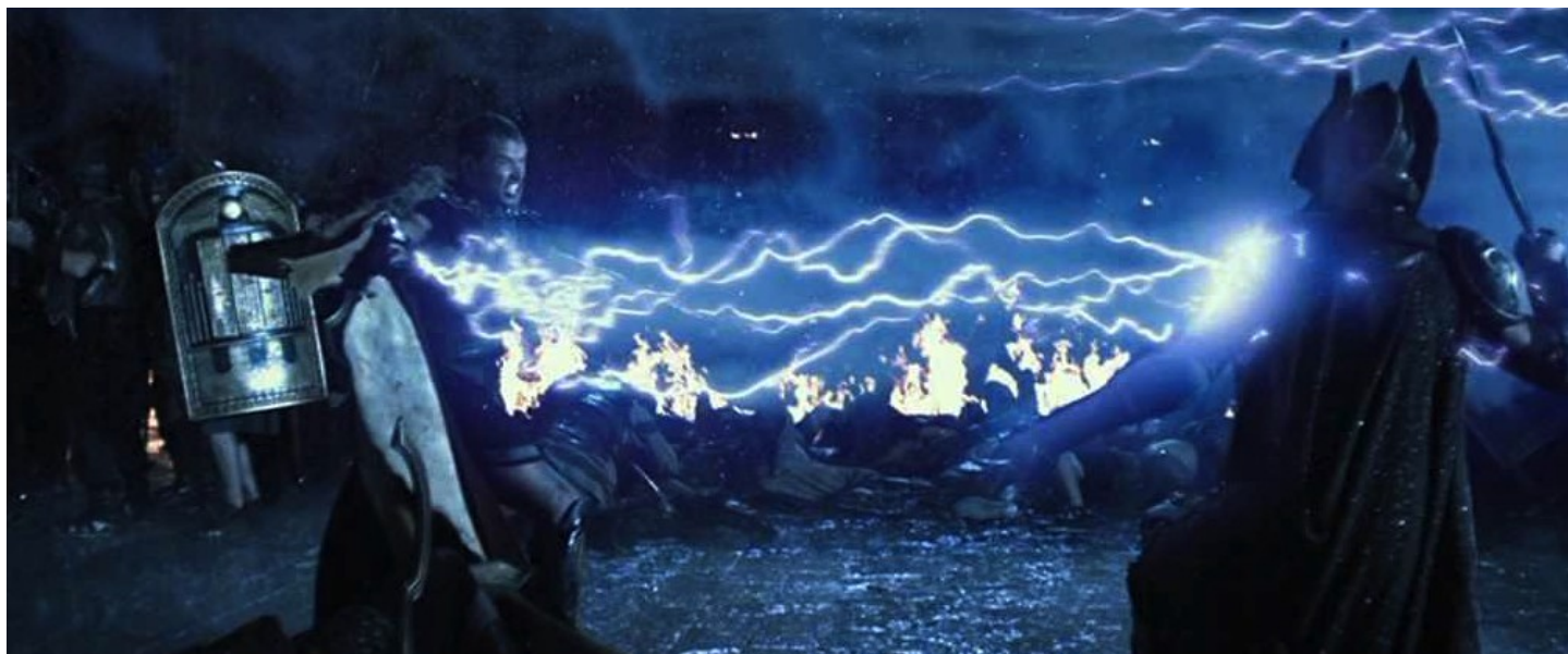
La Légende d'Hercule : Hercule manie le foudre de Zeus son père

Un film dans la droite ligne des péplums mythologiques de ces dernières années, avec une débauche d'effets spéciaux, beaucoup de violence et un irrespect total des récits antiques : Amphitryon, le mari d'Alcmène, la mère d'Hercule, est un sanguinaire roi de Tirynte, qui s'appuie sur des masses de mercenaires venus de Germanie, d'Égypte et de la Corne de l'Afrique pour asseoir sa tyrannie ; et Hercule, qui tue au passage le Lion de Némée (seul respect de la tradition !) et s'en fait voler la peau par son demi-frère Iphiclès, devient un gladiateur redoutable (quel anachronisme !) et un guerrier invincible.