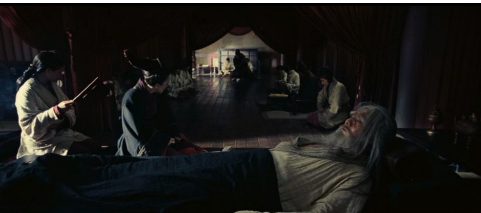
The Last Supper : Liu Bang sur son lit de mort

Revenons au film The Last Supper : en conclusion de notre brève présentation, nous nous risquerons à formuler une hypothèse sur la longue interdiction de ce wu xia pian par les autorités chinoises. Le message qui ressort assez clairement à la fin de l'œuvre, c'est qu'un simple roturier peut se hisser au pouvoir suprême et que, quand il y arrive, cette réussite lui monte à la tête ; il se croit menacé de partout, même de ses plus fidèles partisans ; il pense qu'il doit faire des purges et éliminer ses plus proches amis. Et cette paranoïa va contaminer son entourage : ainsi, dans le film, après la mort de Liu Bang en -195, son épouse fera exécuter ses concubines et leurs enfants. Le résultat de cette politique léonine est que plus personne n'ose rien dire et que tout le monde se soumet (à la cour, tous, à l'exception de l'impératrice, doivent marcher pliés en deux pour marquer leur humble soumission).