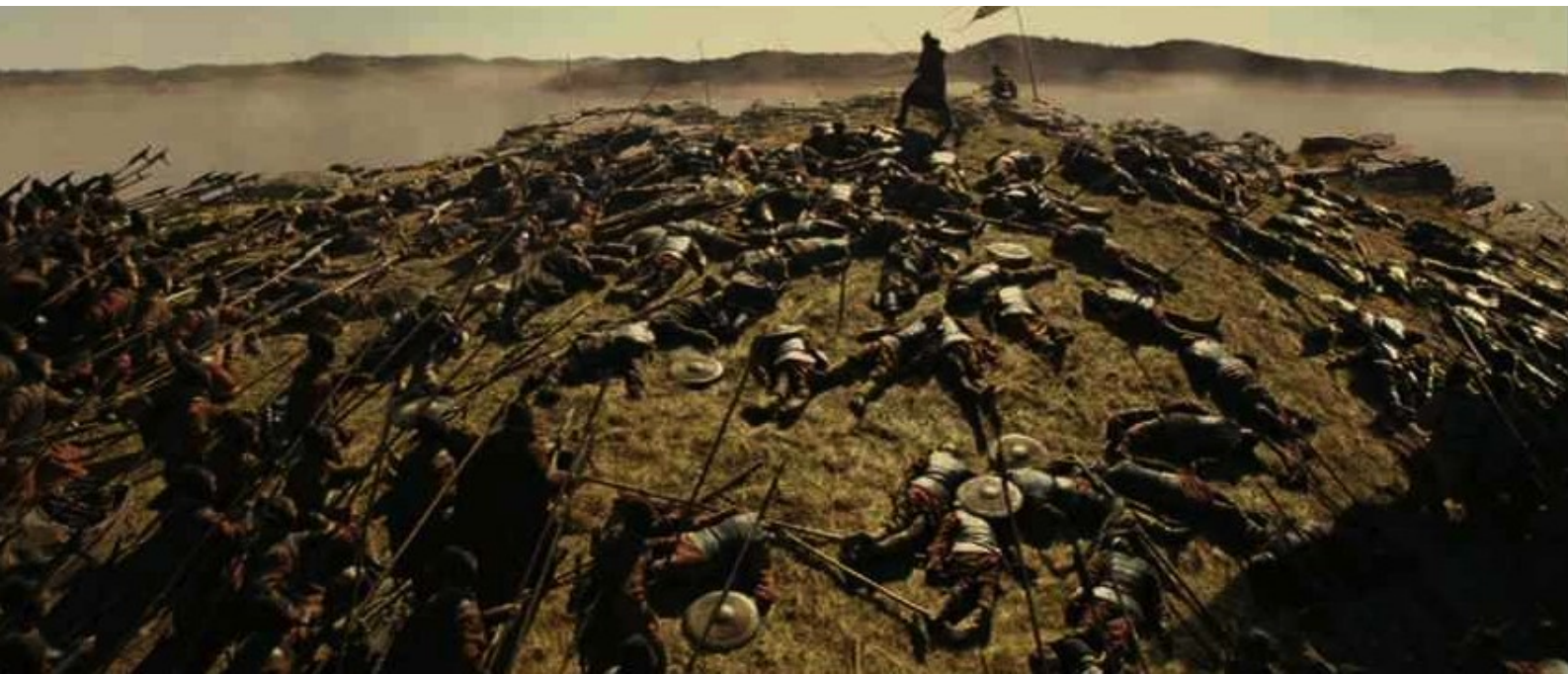
The Last Supper : le dernier assaut d'une bataille

En 207 av. J-C, le général Xiang Yu bat le gros de l'armée du royaume de Qin stationnée à Julu. Parallèlement, Liu Bang prend d'assaut la ville de Xianyang. Sur l'avis de son conseiller militaire, Liu Bang installe ses troupes près de la ville de Xianyang avant d'y entrer. Il envoie d'abord des hommes pour garder le trésor de l'Etat, puis reconforte les habitants. Ses soldats traitèrent en effet avec clémence ces derniers en observant strictement les disciplines militaires. La population soulagée souhaitait donc voir Liu Bang monter sur le trône. Mais ce dernier préférait attendre et ne pas se proclamer empereur tout de suite.