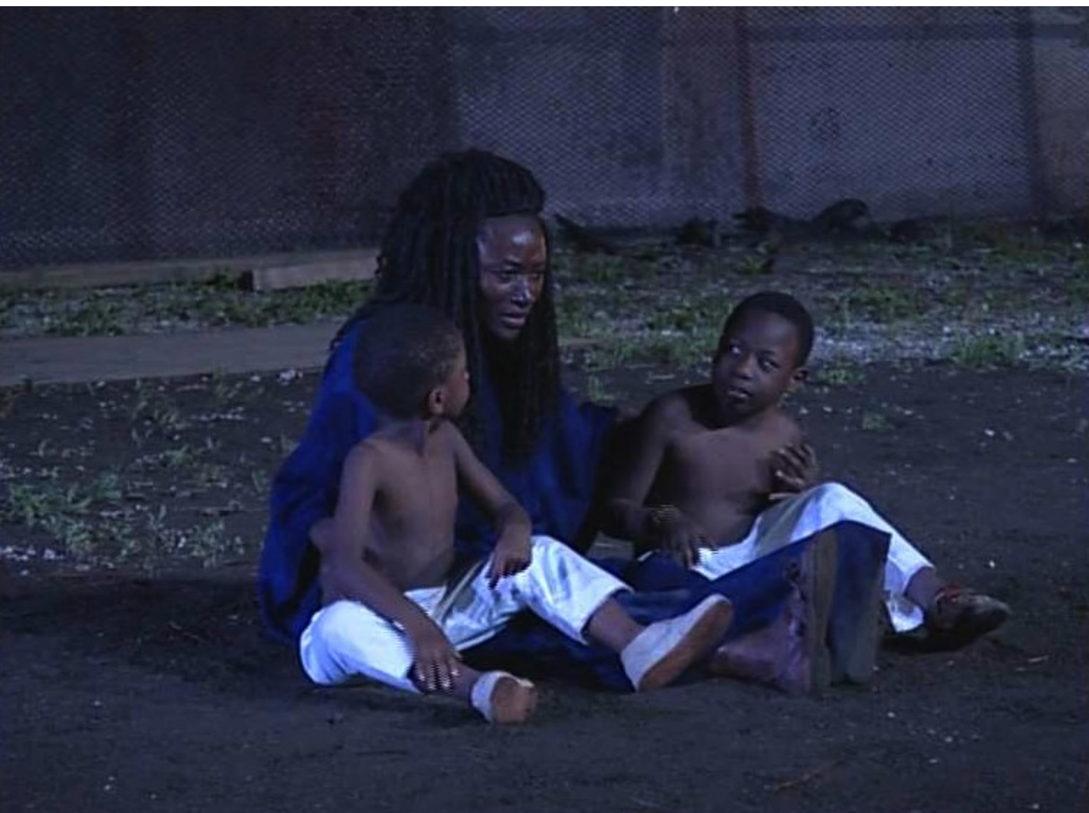
Médée de Max Rouquette : Médée et ses enfants

déracinée de son pays et qui vit douloureusement l'épreuve du déracinement. Cela donne une dimension tragique au drame de la princesse colchidienne.