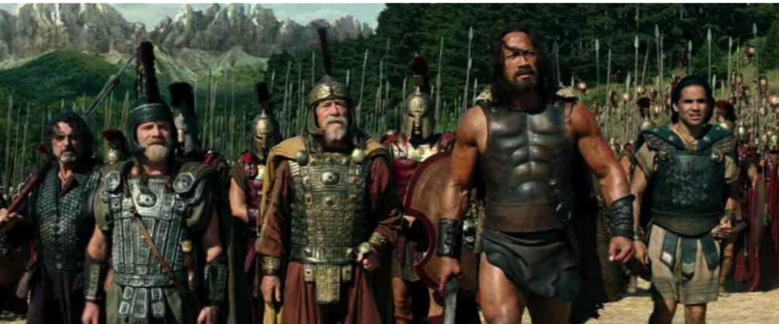
Hercule (Brett Ratner) : Hercule, qui a été recruté comme mercenaire...

Au milieu de divers sujets, vous trouverez donc dans le numéro actuel nos quelques réflexions personnelles sur le film Hercule de Brett Ratner, et nous réservons notre étude sur l'orphelin de Zhao pour une édition subséquente de notre fanzine.