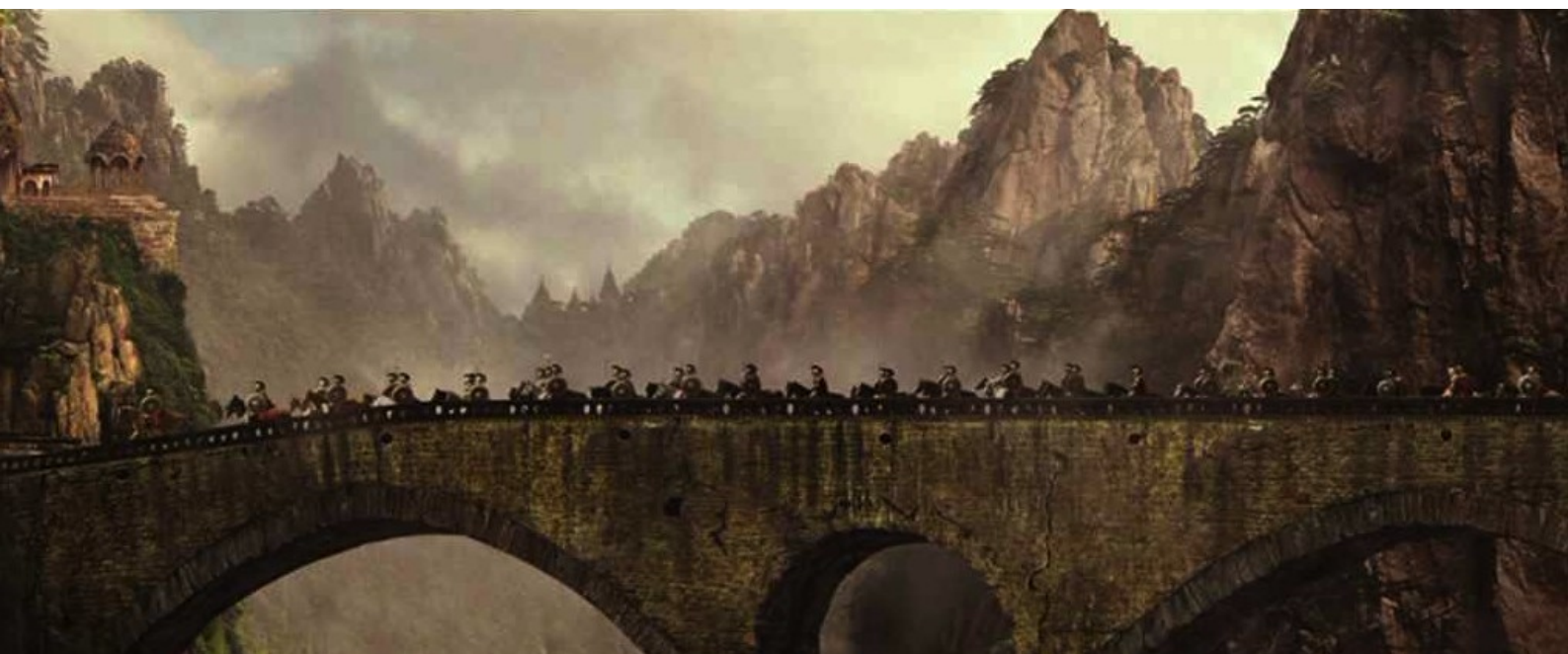
La Légende d'Hercule : les décors irréalistes

Si l'on excepte quelques séquences bien inspirées qui, ô surprise, échappent au carcan de la réalité virtuelle, on a un bien piètre résultat. Mais il faut caresser le chat (le public jeune des salles obscures) dans le sens du poil et jeter en pâture à ses pupilles ignares des images de violence démesurée et de décors irréalistes.