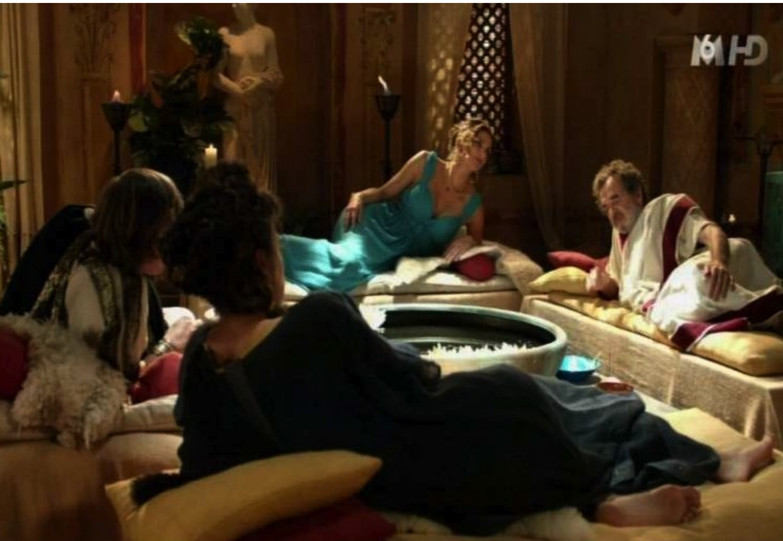
Peplum : scène de triclinium