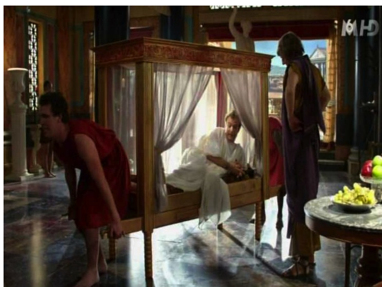
Peplum : l'empereur Maximus en litière

http://www.google.fr/imgres?imgurl=http%3A%2F%2Fwww.planetzot.com%2Fimg%2Ftoons%2Fdsn%2Fss_gold%2Fss_gold_img5.jpg&imgrefurl=http%3A%2F%2Fwww.planetzot.com%2Fcartoon_summary.php%3Fid%3D300&h=428&w=570&tbnid=XknGp2UUAHX8jM%3A&zoom=1&docid=_bHbrByEwZ_6BM&ei=XY8JVMjFNoWQ7AaXs4DoDA&tbn=isch&iact=rc&uact=3&dur=2557&page=1&start=0&end=22&ved=0CFMQrQMwEQ