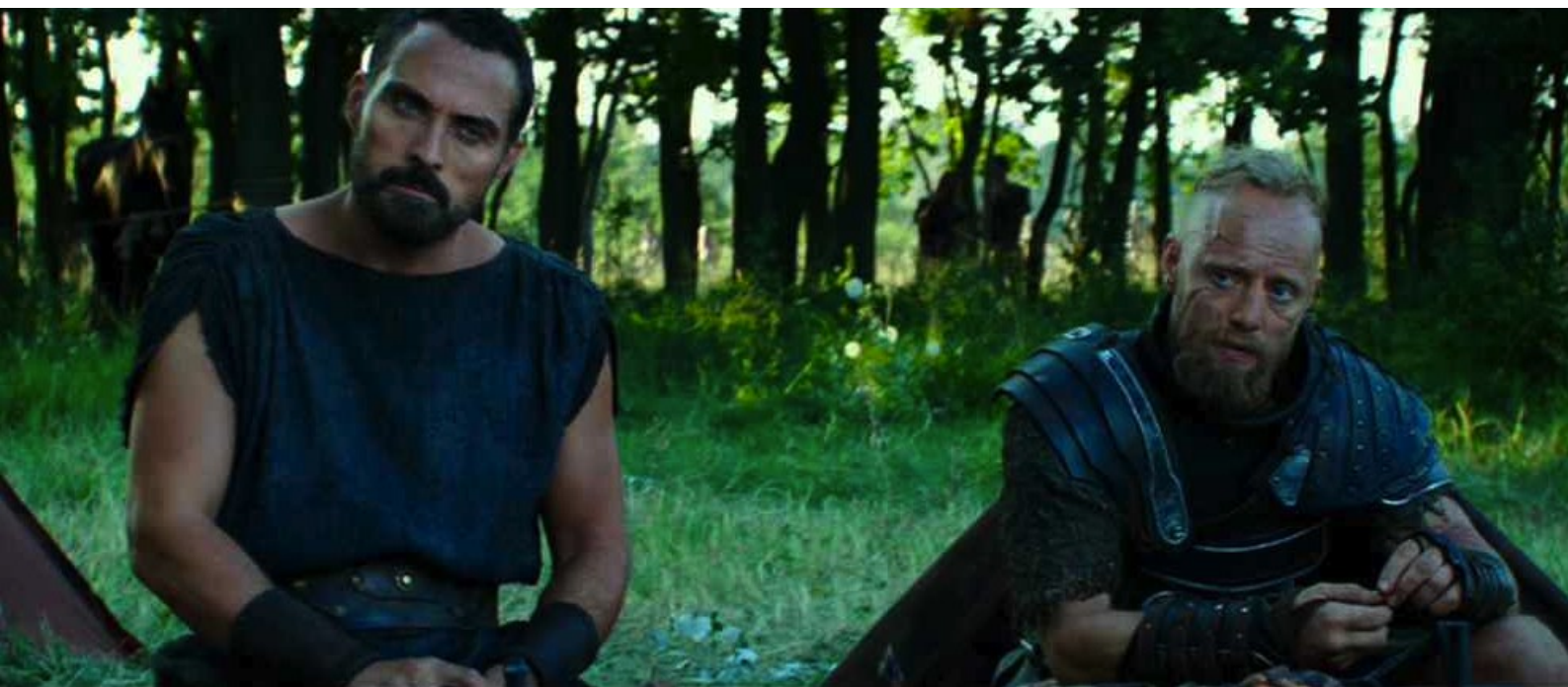
Hercule (Brett Ratner) : Autolykos et Tydée

Les divers mercenaires du groupe des Grecs ont des caractères bien définis, mais ils sont beaucoup plus caricaturaux dans le roman graphique. Ainsi le guerrier Tydée, dans le comics, est constamment obsédé par l'idée de manger les ennemis vaincus et notamment de dévorer leurs cervelles, et ne se fait pas faute de le faire chaque fois que l'occasion se présente. Rappelons que, dans la mythologie grecque, lors du siège de Thèbes, ce personnage a fendu le crâne de son adversaire Mélanippos et en a dévoré la cervelle ; mais c'était resté un cas unique. Dans le film, ce même Tydée est un combattant sauvage, mais sans tendances anthropophages.