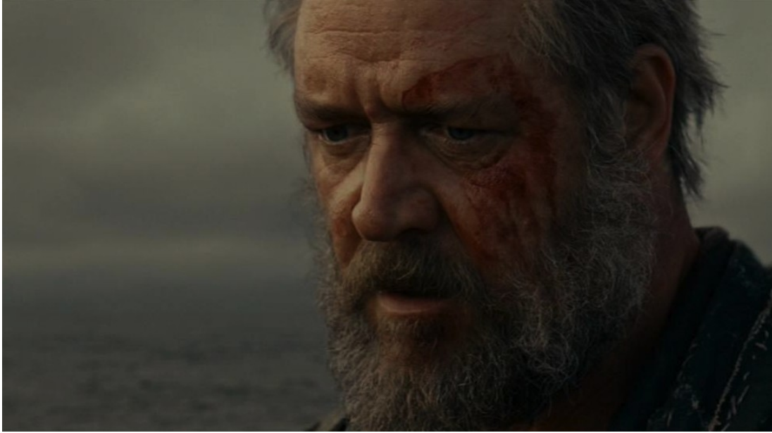
Noé de Darren Aronofski : Noé (Russell Crowe)

Le studio Paramount et Russell Crowe, qui incarnait le patriarche, étaient, paraît-il, tellement fiers de leur film qu'ils espéraient que le pape lui-même visionnât cette réalisation (l'acteur lui a même tweeté : "Seriously though, Noah the movie will fascinate you"! ). Nous ignorons comment le Saint-Père aurait apprécié le spectacle, mais, en ce qui nous concerne, nous avons été effrayé : nous nous attendions à un péplum biblique, nous avons vu une heroic fantasy à gros effets spéciaux, avec des Néphilim, monstres de pierre dignes des Maciste de série B, des geysers destinés à couvrir rapidement d'eau la terre, et surtout un Noé guerrier, missionnaire écologiste et intégriste fanatique et égoïste, qui se croit investi de la mission d'éliminer une fois pour toutes l'humanité, dût-il aller jusqu'à assassiner de ses propres mains ses petits-enfants.