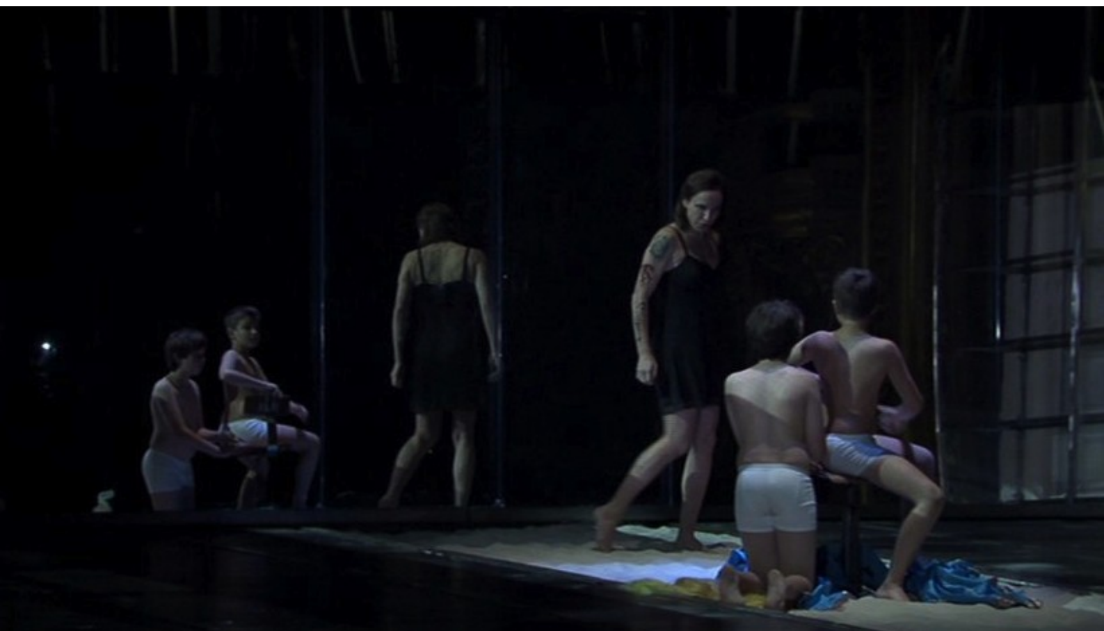
Médée de Cherubini: Médée et ses enfants

Un spectacle sympathique pour les amateurs d'opéra.