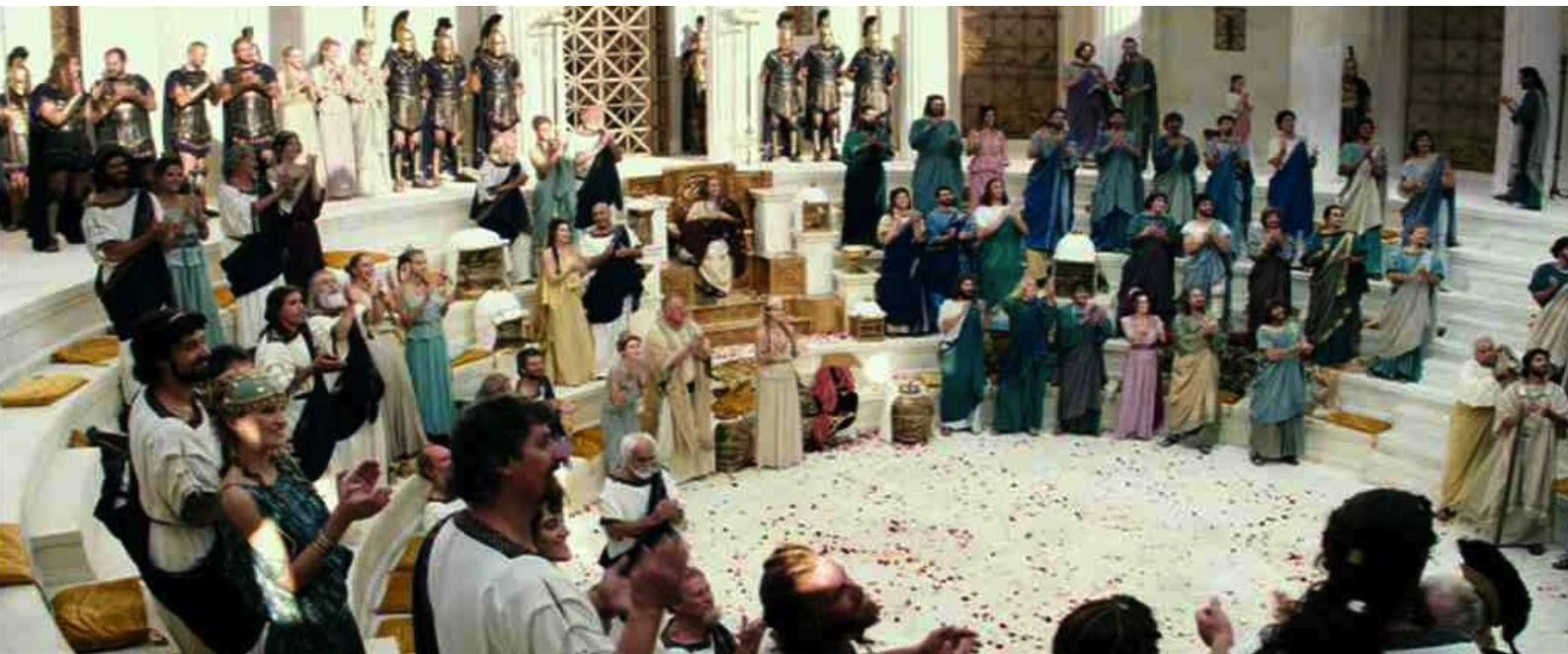
Hercule (Brett Ratner) : le sénat d'Athènes