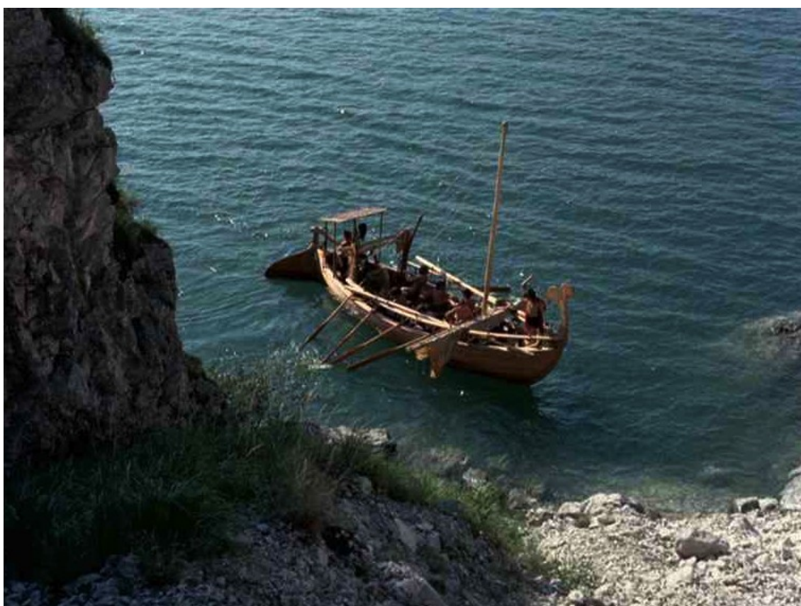
Das Goldene Ding : le bateau Argo accoste

dragon invincible que doit affronter Jason est une sorte de robot d'où sort de la fumée. Mais le cadre géographique, fort peu méditerranéen, du lac autrichien du Traunsee est très sympathique. "Sympathique" est aussi le mot dont nous qualifierions cette modeste production.