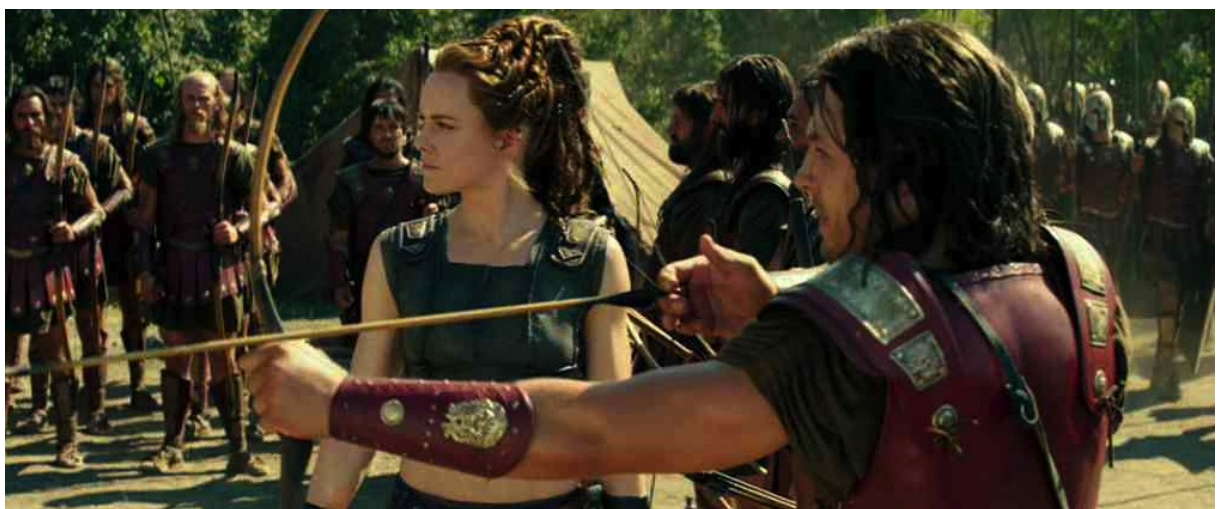
Hercule (Brett Ratner) : Atalante forme un soldat au tir à l'arc

Contentons-nous de dire que le héros de ce péplum n'est pas le fils de Jupiter, mais un guerrier, spécialement puissant, à la tête d'une bande d'amis mercenaires (Atalante, Autolykos, Tydée...) prêts à vendre leurs qualités guerrières au premier venu pour autant qu'ils soient bien payés. Sa légende grandit grâce à son neveu Iolaos, qui se fait le chantre de ses exploits, tout en les aménageant et les complétant à sa guise. Et lui-même est tourmenté par de cruelles visions, qui lui rappellent sans cesse qu'il a tué sa femme Mégara et leurs enfants dans une crise de délire.