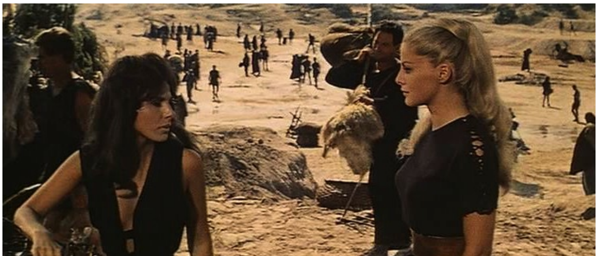
La noiraude Tarpéa et la blonde Julia (Virna Lisi) dans Romulus et Rémus de Sergio Corbucci

À notre connaissance, elle n'a joué que dans un seul péplum, Romulus et Rémus (1961) de Sergio Corbucci, où elle incarnait Julia, la fille du roi des Sabins Tatius, amoureuse d'une passion réciproque du héros Romulus. Néanmoins, il est difficile pour nous d'oublier comme elle a éclairé ce film de sa blonde présence, en antithèse avec la noire et jalouse Tarpéa.