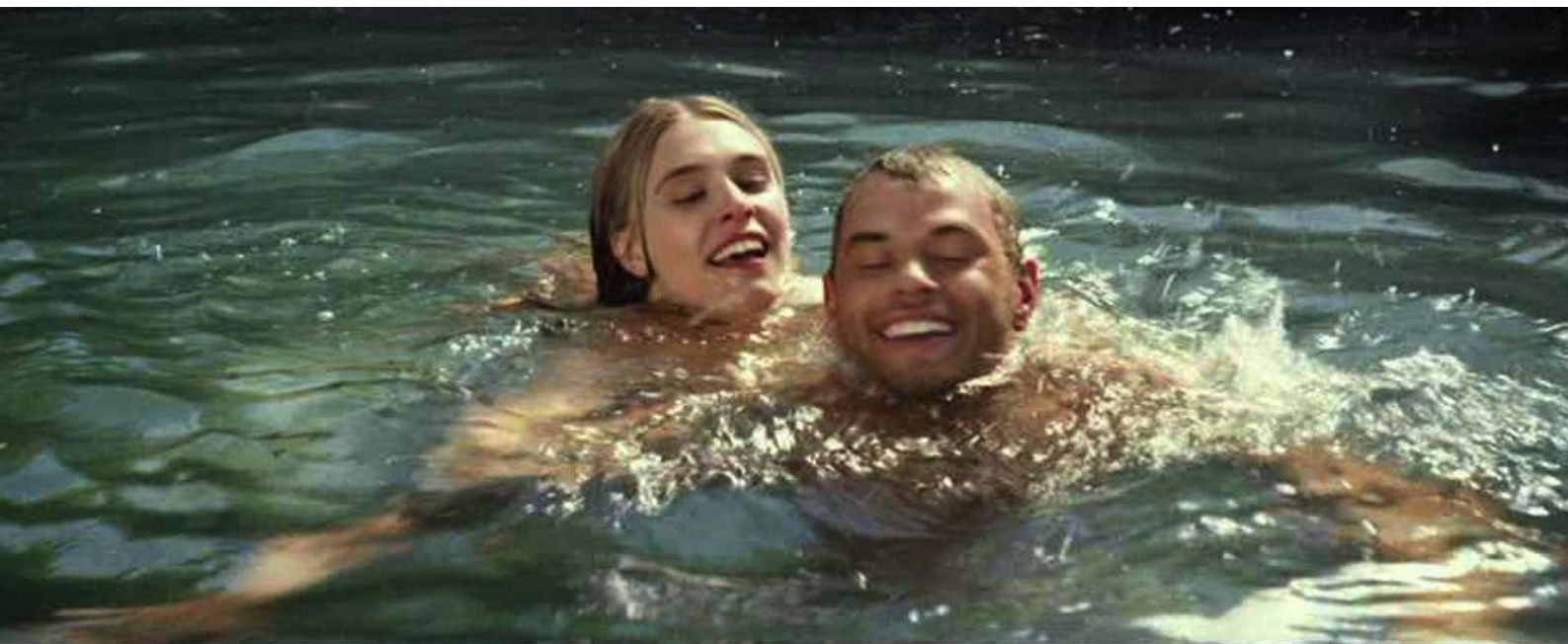
La Légende d'Hercule : Hercule et sa fiancée Hébé

Si l'on excepte quelques séquences bien inspirées qui, ô surprise, échappent au carcan de la réalité virtuelle, on a un bien piètre résultat. Mais il faut caresser le chat (le public jeune des salles obscures) dans le sens du poil et jeter en pâture à ses pupilles ignares des images de violence démesurée et de décors irréalistes.