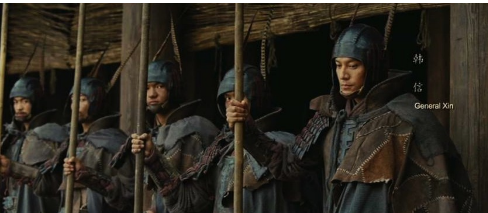
The Last Supper : soldats

On peut notamment le constater sur la capture d'écran ci-dessous, prise au milieu du film, et qui indique à droite, en caractères chinois, le nom d'un personnage qui apparaît dans les secondes suivantes, ainsi que le nom de l'acteur (inscription en anglais rajoutée postérieurement sur la version diffusée en Occident).