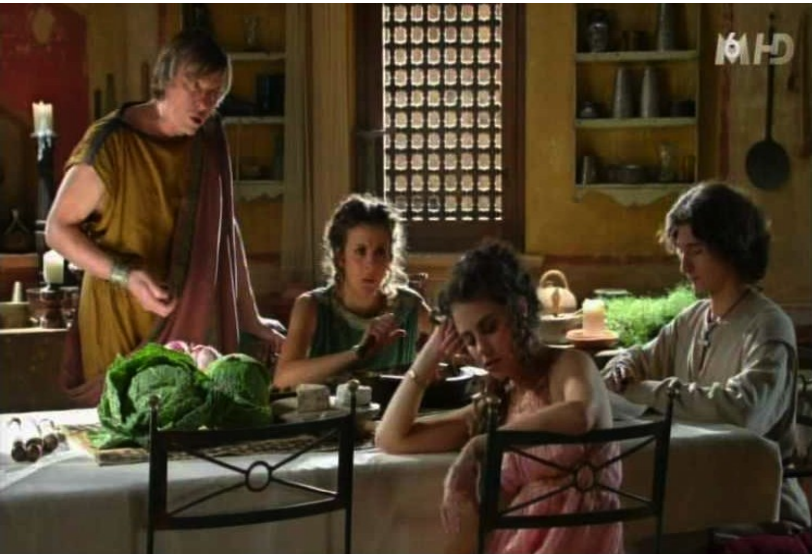
Peplum : la famille de Bravus, sa femme Octavia, sa fille délurée Lydia et son fils chrétien Caius

épouse Octavia, étrangère aux codes de la bonne société romaine et sa fille délurée Lydia qui les assimile trop bien. Peplum , ou comment éviter le burn out dans une société en déclin. Le parallèle avec aujourd'hui ne saurait être une coïncidence" ( http://www.leblogtvnews.com/2014/09/nouveaute-peplum-sur-m6-avec-jonathan-lambert-teaser.html ).