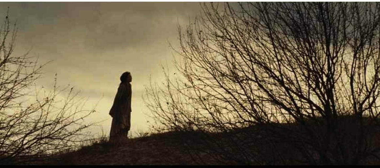
The Last Supper : scène crépusculaire

Quant à nous, nous partageons partiellement le jugement de Gregory Coutaut, qui qualifie ailleurs ce film de ”bloc hermétique”, malgré sa beauté esthétique épurée et le message de philosophie politique qu’il contient.