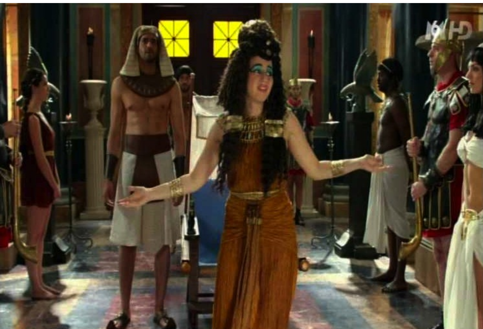
Peplum : l'arrivée de la reine Cléopâtre IX au palais de Maximus

Vous adorez le péplum, vous avez aimé Kaamelott , allez-vous apprécier Peplum ?