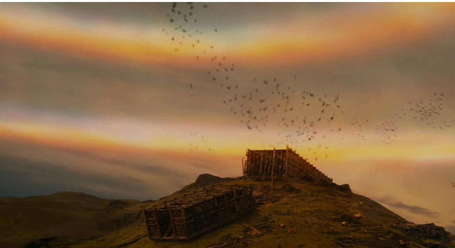
Noé de Darren Aronofski : l'arche s'est posée après la fin du déluge

Si la presse américaine s'est révélée assez enthousiaste pour cette œuvre formatée pour le goût du public états-unien, la critique francophone a conclu que "bah, c'est vrai que Noé n'est pas bon, mais après tout il n'est pas si mauvais, parce que... parce que... parce que...". En quelque sorte une analyse de Normand... ou de Vaudois.