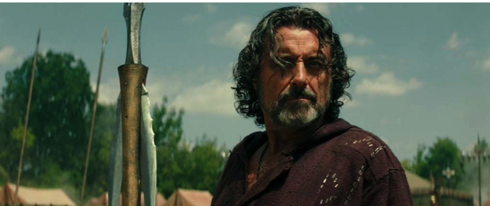
Hercule (Brett Ratner) : Amphiaraos

Nous nous prenons à espérer que cette œuvre, annoncée à la fin du premier comics et également disponible en français, soit aussi adaptée convenablement au cinéma. Quand un journaliste a posé cette question à Steve Moore, il a répondu, en parlant de ses producteurs cinématographiques : "Je suis installé à Londres et ils s'occupent de développer des films en Californie. Je ne suis pas très au courant. J'imagine qu'ils attendent de voir comment marche le premier film avant de prendre une décision à propos du deuxième..." (Comics Bulletin, à la fin d' Hercule et les Dagues de Koush ).