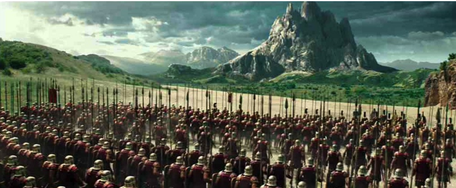
Hercule (Brett Ratner) : une armée thrace

Depuis bien des mois, absorbé par beaucoup d'autres activités, nous avons procrastiné la parution de notre nouveau numéro de La Douzième Heure . Nous avons notamment entamé un dossier qui nous semblait passionnant sur les représentations cinématographiques d'un épisode dramatique de l'histoire chinoise, événement complètement méconnu en Occident.