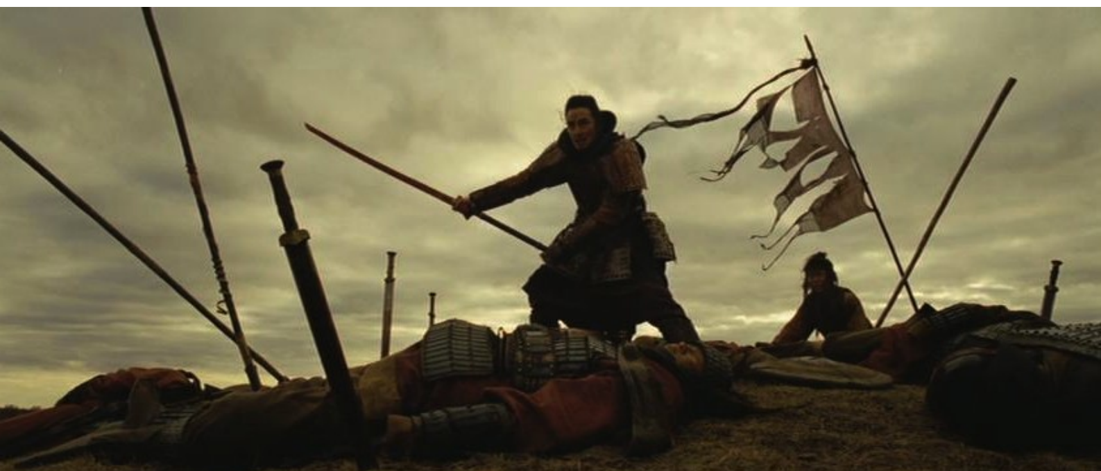
The Last Supper : scène de bataille

Le présent numéro offre un dossier plus bref que d'habitude : c'est donc pour nous l'occasion d'offrir un petit complément sur un film chinois au destin curieux : The Last Supper (Le Dernier Repas) de Lu Chuan.