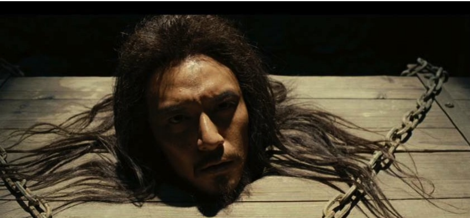
The Last Supper : prisonnier dans un carcan

- Xiang Yu ne pourra jamais rien accomplir de grand. Dans un proche avenir, c'est certainement Liu Bang qui s'emparera du monde.