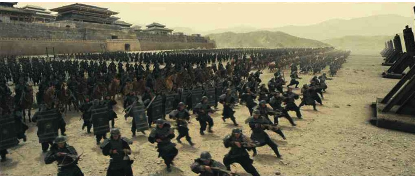
Le Dernier Royaume : scène de bataille

En 2012, un autre cinéaste, Daniel Lee, a lui aussi essayé de porter à l'écran le Banquet de Hongmen dans un film bavard et médiocre, Le Dernier Royaume . Un commentateur en dit que c'est une fresque plate, qui s'égare dans des considérations intimistes et autres discussions interminables plutôt que de développer et d'inscrire à