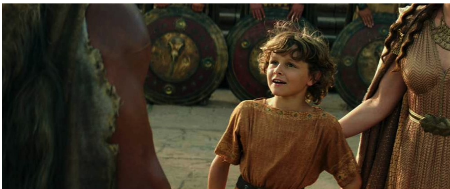
Hercule (Brett Ratner) : Arius, grand admirateur d'Hercule

Mais finalement la différence la plus notable se marque dans la descendance du méchant roi Cotys. Dans le roman graphique, ce souverain thrace utilise sa fille Ergénia comme une Mata Hari : elle offre à de multiples reprises son corps au naïf Hercule qui se croit aimé par la belle princesse. Dans les faits, sous la couette, elle lui soutire des confidences qu'elle livre à son père. Dévoilée, elle meurt transpercée d'une lance pendant la lutte finale, au moment où elle va égorger Atalante.