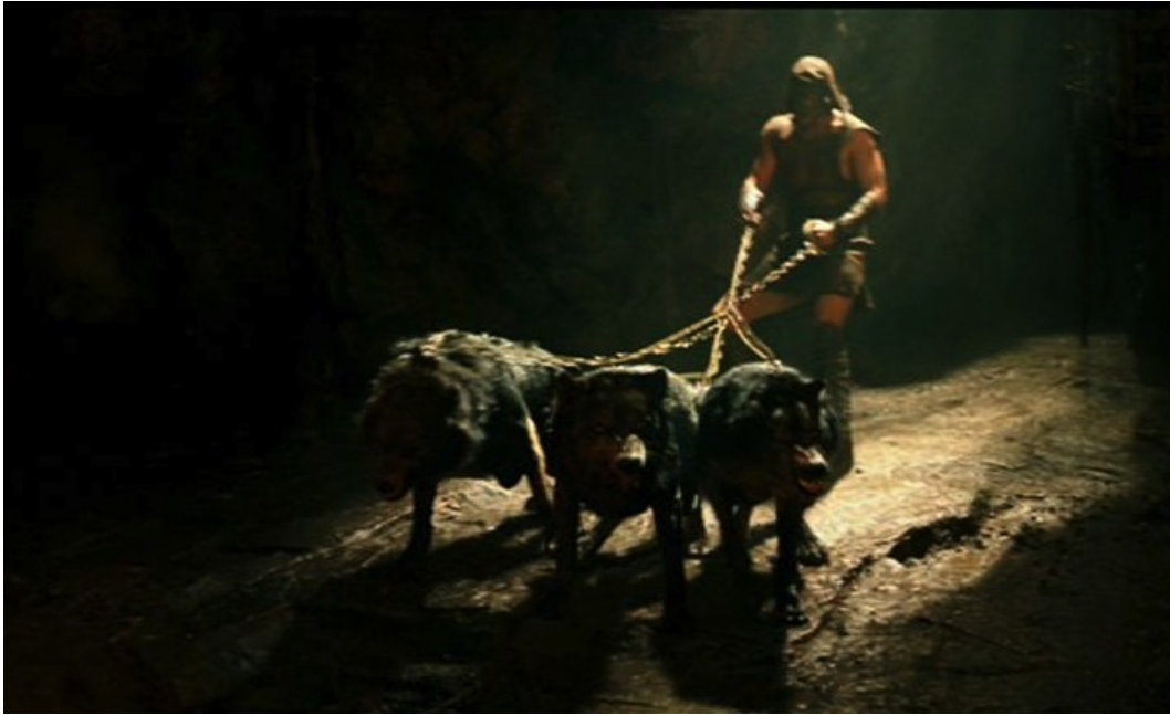
Hercule (Brett Ratner) : les loups

Les divers mercenaires du groupe des Grecs ont des caractères bien définis, mais ils sont beaucoup plus caricaturaux dans le roman graphique. Ainsi le guerrier Tydée, dans le comics, est constamment obsédé par l'idée de manger les ennemis vaincus et notamment de dévorer leurs cervelles, et ne se fait pas faute de le faire chaque fois que l'occasion se présente. Rappelons que, dans la mythologie grecque, lors du siège de Thèbes, ce personnage a fendu le crâne de son adversaire Mélanippos et en a dévoré la cervelle ; mais c'était resté un cas unique. Dans le film, ce même Tydée est un combattant sauvage, mais sans tendances anthropophages.