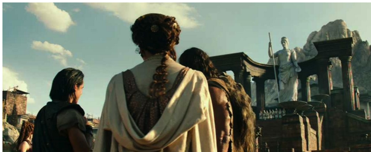
Hercule (Brett Ratner) : Hercule arrive en Thrace

Ce péplum est une adaptation filmique du comics de Steve Moore, Hercule : Les Guerres Thraces . Pour rédiger le scénario de cette œuvre, le Britannique s'est fortement imprégné de mythologie grecque, se passionnant pour le sujet et consultant de nombreux textes antiques et de multiples sources compétentes. Il en tire une histoire située en 1200 avant J.-C. peu avant la date traditionnelle de la guerre de Troie (1184 avant J.-C.) et regroupant majoritairement des personnages connus dans les mythes antiques ; il choisit un volet peu développé du cycle d'Héraclès et le complète avec l'ambition d'humaniser et de démythifier le demi-dieu ; il lui donne tout un groupe de compagnons, ce que l'on voyait rarement dans les légendes grecques.