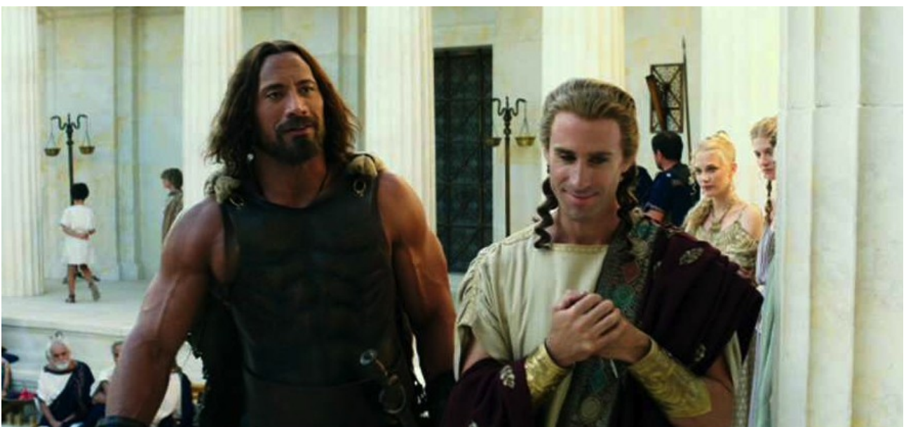
Hercule (Brett Ratner) : Hercule et Euristhée