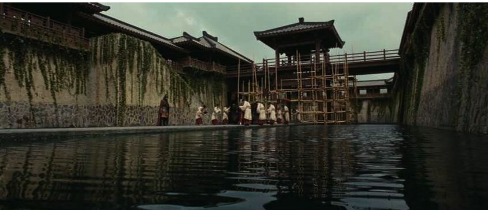
The Last Supper : l'entrée du palais impérial

Rappelons ce que nous avons sans doute écrit à plusieurs reprises : l'histoire chinoise est l'histoire complexe et multimillénaire d'un immense sous-continent. Les actuels habitants en connaissent les grands événements au même titre que nous, Européens, nous avons entendu parler de la guerre de Troie, d'Alexandre le Grand, de César et Cléopâtre, et de Napoléon. Ils ont donc assurément une idée relativement précise d'un de ces épisodes célèbres du passé de l'Empire du Milieu, le Banquet de Hongmen.