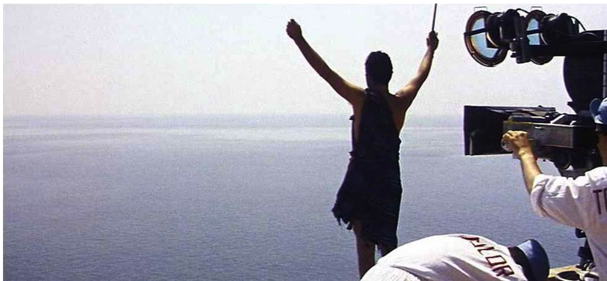
Le Mépris : Ulysse retrouve sa patrie

tournage d'un péplum fictif sur Jules César ; mais on glissera dans un autre registre, celui du comique.