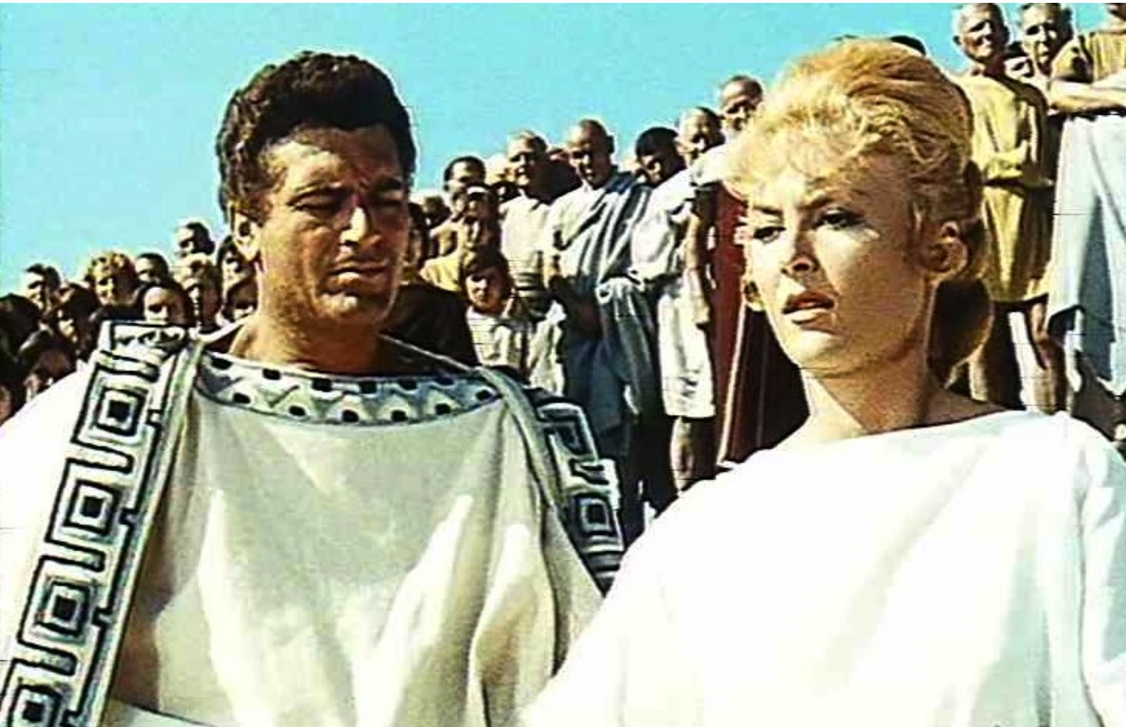
Drusco (Louis Jourdan) et Clélie dans Les Vierges de Rome

Par ailleurs, le 14 février 2015 s'est éteint à Beverly Hill le french lover et chanteur Louis Jourdan à l'âge de 93 ans.