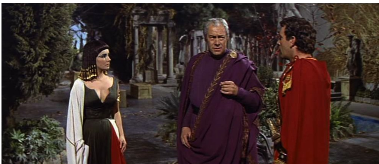
Cléopâtre (Liz Taylor) avec Jules César et Marc-Antoine

Encore faut-il trouver un réalisateur... Produit par Sony, tiré du best-seller de Stacy Schiff ( Cleopatra, a life ), le projet est un vrai serpent de mer qui alimente la chronique depuis quatre ans. Au départ, on annonce un film en 3D réalisé par James Cameron, qui préfère finalement se concentrer sur la suite d' Avatar . Puis on évoque David Fincher, proche de Brad Pitt, qui jette l'éponge. Le cinéaste Ang Lee lit le script, mais ne donne pas suite. Bref, on patine et aucun réalisateur n'a pris encore en main le projet, peut-être en raison d'un scénario mal ficelé dès le départ ou la crainte de s'attaquer à un personnage légendaire du 7e art.