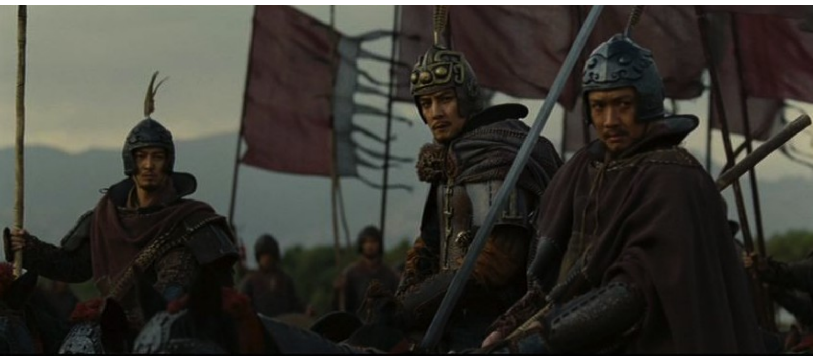
The Last Supper : officiers

nombre, certains usèrent de sagesse pour combattre des adversaires vaillants, mais peu raisonnables.