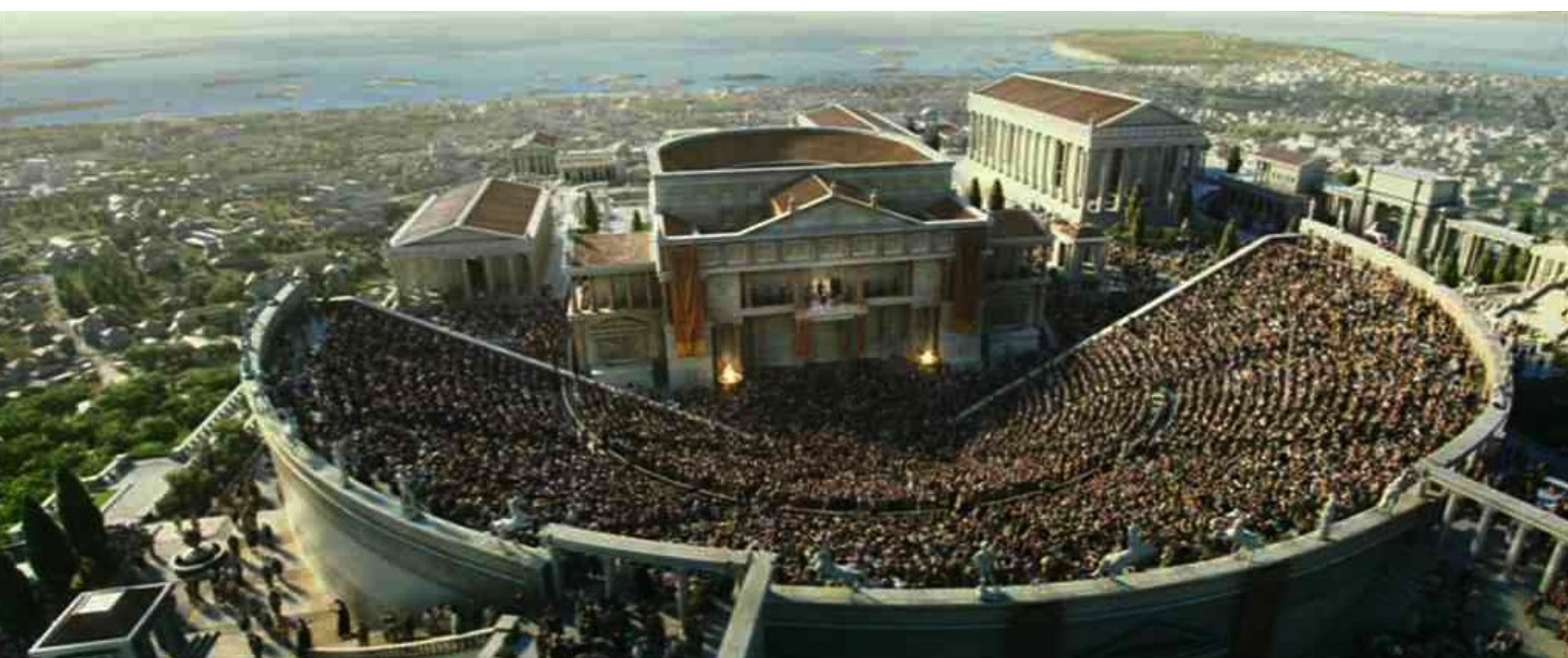
Hercule (Brett Ratner) : le théâtre d'Athènes

Nous nous prenons à espérer que cette œuvre, annoncée à la fin du premier comics et également disponible en français, soit aussi adaptée convenablement au cinéma. Quand un journaliste a posé cette question à Steve Moore, il a répondu, en parlant de ses producteurs cinématographiques : "Je suis installé à Londres et ils s'occupent de développer des films en Californie. Je ne suis pas très au courant. J'imagine qu'ils attendent de voir comment marche le premier film avant de prendre une décision à propos du deuxième..." (Comics Bulletin, à la fin d' Hercule et les Dagues de Koush ).