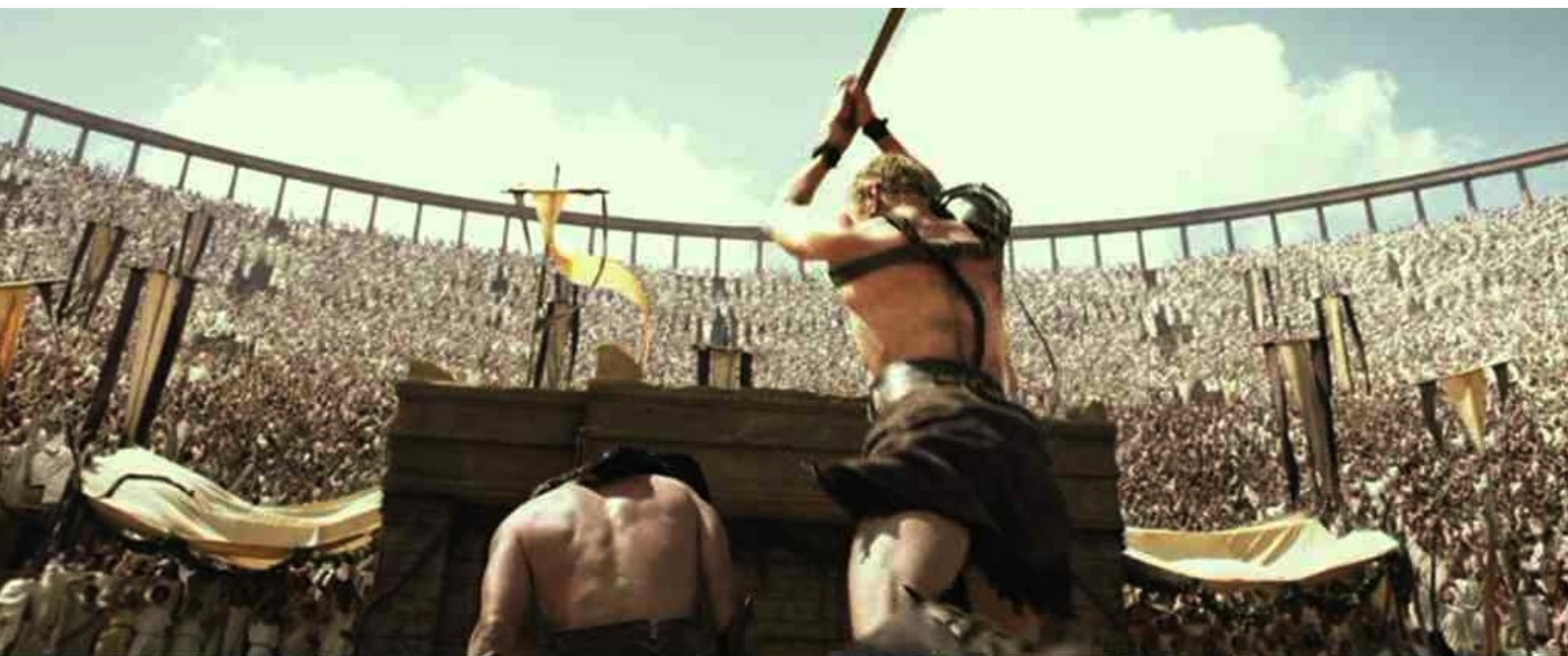
La Légende d'Hercule : Hercule gladiateur massacre tous ses adversaires

Un film dans la droite ligne des péplums mythologiques de ces dernières années, avec une débauche d'effets spéciaux, beaucoup de violence et un irrespect total des récits antiques : Amphitryon, le mari d'Alcmène, la mère d'Hercule, est un sanguinaire roi de Tirynte, qui s'appuie sur des masses de mercenaires venus de Germanie, d'Égypte et de la Corne de l'Afrique pour asseoir sa tyrannie ; et Hercule, qui tue au passage le Lion de Némée (seul respect de la tradition !) et s'en fait voler la peau par son demi-frère Iphiclès, devient un gladiateur redoutable (quel anachronisme !) et un guerrier invincible.