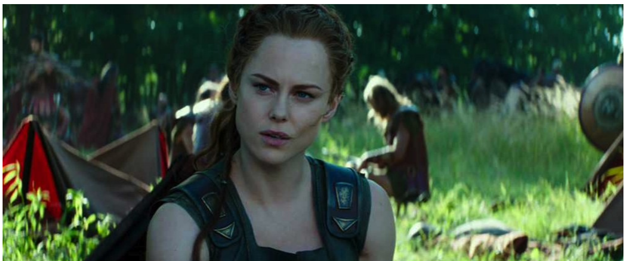
Hercule (Brett Ratner) : Atalante

Contrairement au roman graphique, qui prend une tonalité beaucoup plus sombre et plus dure et qui n'a pas besoin d'une amourette romantique, mais de "bons" et surtout de "méchants", le scénariste du film a sans doute imaginé ces relations de famille différentes pour introduire un doux élément féminin permettant de montrer une idylle Hercule-Ergénia qui puisse plaire au public. Il faut reconnaître qu'Atalante, guerrière redoutable, mais insensible à l'amour, ne pouvait pas jouer ce rôle.